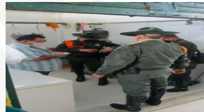
Operativo Expendios de carne – Carmen de Apicalá