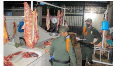
Operativo Plaza de mercado -Guamo