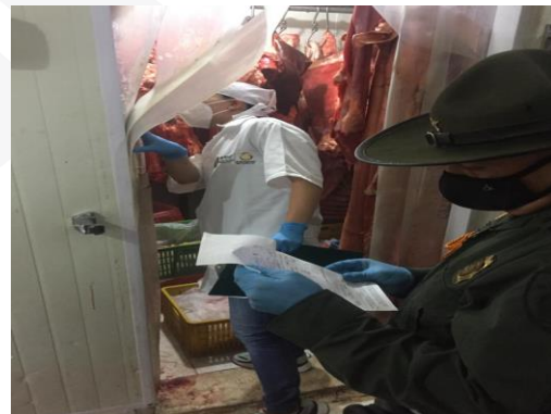
Operativo expendio de carnes - Guamo