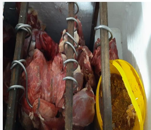
Operativo expendio de carnes - Melgar