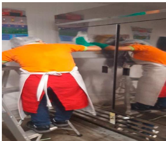
IVC Grandes superficies Cajamarca