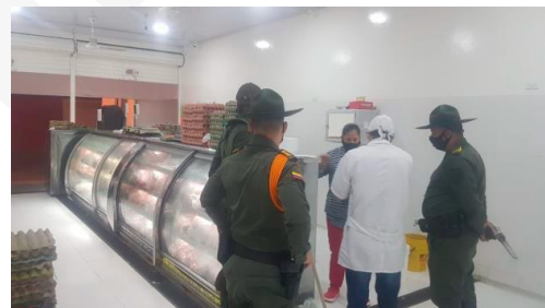
Operativo a expendios de carne independientes y de plaza de mercado – Melgar