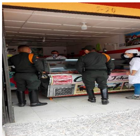
IVC Expendios de carne y/o productos cárnicos comestibles Líbano