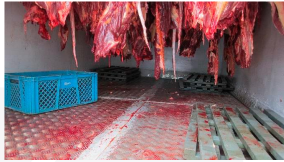
Vehículo transportador de carne- Cajamarca