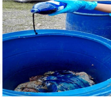
Operativo expendio de carnes -Libano